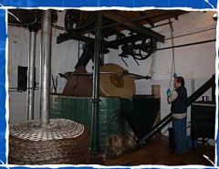
MOLINO DE BENAGALBÓN